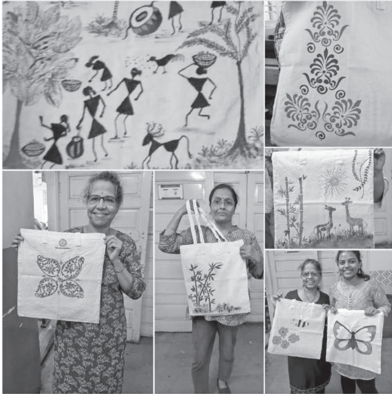
गोरेगाव कार्यशाळेत सजलेल्या पिशव्या

पिशवी वापरता येईल किंवा भेट देताना स्वहस्ते सजवून दिलेल्या कापडी पिशव्या नक्कीच वहावा मिळवतील आणि जपून वापरल्याही जातील, असे कार्यशाळेत सहभागींना