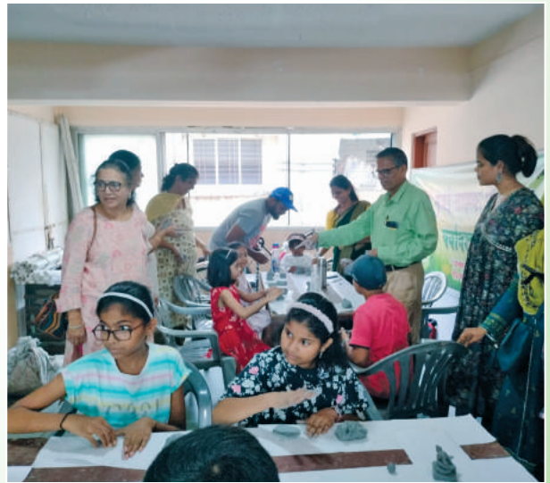
गणपती कार्यशाळेत रममाण झालेली बच्चेकंपनी!