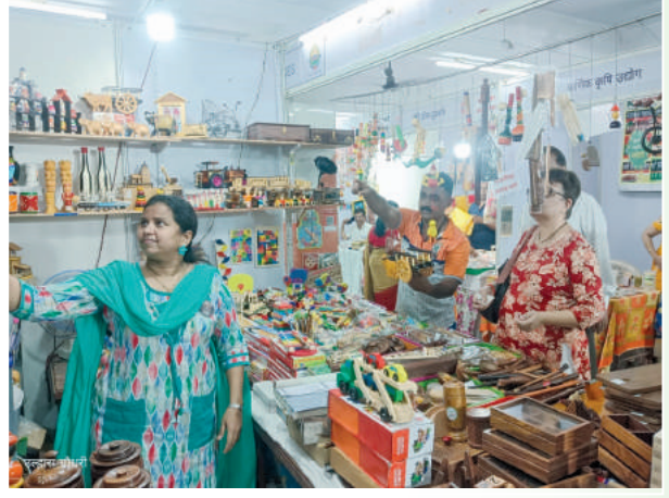
मनमुराद खरेदीत दंग झालेले पालघरकर!